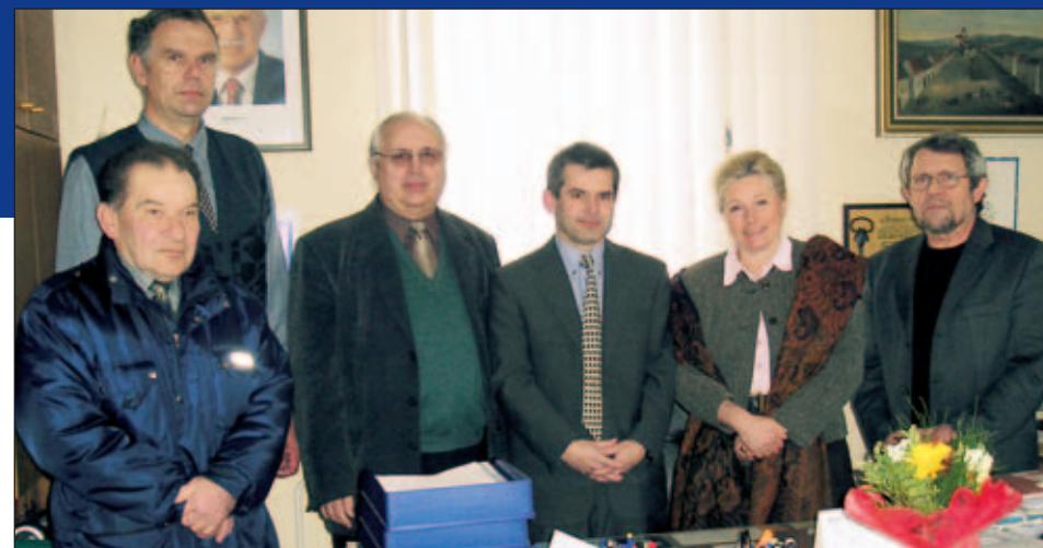
Přijetí u starosty obce Kunžak na Jindřichohradecku

službách, které jsou ještě velkou rezervou pro nové pracovní příležitosti. Také český stát se ovšem musí zasadit o dostupnost bankovních úvěrů pro podnikatele. Jsem hluboce přesvědčená, že právě toto je klíč k prosperitě České republiky v rámci prosperující Evropy jako kontinentu.