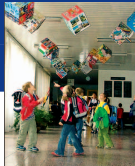
Zuzana Roithová besedovala 5. 12. 2005 se žáky ZŠ Neratovice (seznámení s EU se věnovali ve školním projektu „Evropský rok“)

■ Od května 2001 do listopadu 2003 byla místopředsedkyní KDU-ČSL se zodpovědností za program a zahraniční vztahy. Dále je členkou Celostátní konference KDU-ČSL. Od roku 2000 je členkou Evropského hnutí České republiky, které je součástí Mezinárodního evropského hnutí se sídlem v Bruselu. Od března 2000 do března 2002 byla předsedkyní tohoto hnutí.