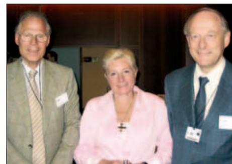
Z. Roithová předsedala 14. 6. 2005 v Evropském parlamentu semináři o infekčních chorobách

■ V červnových volbách 2004 byla zvolena poslankyní Evropského parlamentu. Je členkou poslaneckého klubu „Evropské lidové strany – Evropských demokratů“. Byla zvolena místopředsedkyní Výboru pro vnitřní trh a ochranu spotřebitelů, stala se zastupující členkou Výboru pro zahraniční obchod a Výboru pro práva žen a rovnost pohlaví. Dále působí v Delegaci Evropského parlamentu pro Společný parlamentní výbor AKT-EU (africké, karibské a tichomořské státy).