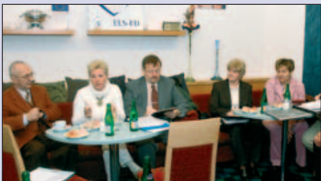
Schůzka se zástupci Sdružení na ochranu spotřebitelů, výrobců obuvi a lékařů v Hradci Králové 3. 11. 2005