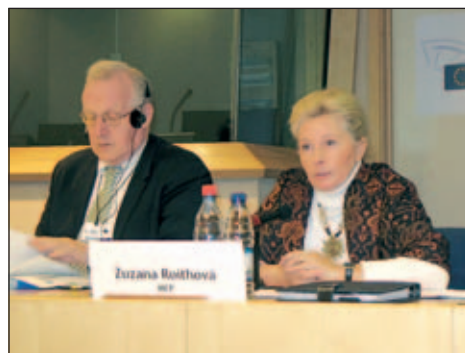
Tisková konference v EP 10. 11. 2005 na téma Práva spotřebitelů v digitálním prostředí

Podporuji změnu struktury fondů tak, aby jejich programy jednak ještě více motivovaly k inovacím, dále aby umožnily větší aktivitu obcí, malých podnikatelů i neziskových organizací v podnikání ve