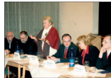
Setkání s regionálními politiky Pardubického kraje v Němčicích 2. 11. 2005

Evropa stárne. Za posledních 100 let se průměrný život prodloužil z 55 na 80 let, navíc se rodí stále méně dětí. V roce 2030 začne obyvatelstvo starého kontinentu vymírat. Stárnutí populace spolu s vysokými nároky na zdravotní a sociální služby jsou fenoménem, který přináší Evropanům nejen společenské a kulturní změny, ale i ekonomické problémy. Jejich zodpověd-