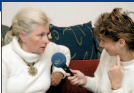
Rozhovor pro Český rozhlas

Nejen premiér Paroubek vnímá čínský trh jako obrovskou příležitost prodat do Číny technologie, které jí zatím chybějí a díky nimž zavalí Evropu dalším sortimentem laciného zboží. Zákazníci se radují z nízkých cen, ale jen do té doby, než přijdou o práci, protože ani jejich továrna brzy nebude schopna čelit čínské konkurenci. Evropské provozy se postupně přesouvají na Východ, protože tam lze beztrápně vyrábět bez dodržování základních ekologických a sociálních standardů, což umožňuje výrobu za neuvěřitelně nízké ceny. Ty jsou však draze zaplacené životními podmínkami lidí, kteří často jen s hrstkou rýže k večeri žijí ve slumech ve městech plných exhalací a dřou v podmínkách, které přes půl století neznají v Evropě ani obyvatelé nejtvrděších věznic. Stejně tak čínská vláda neváhá podporovat nebezpečný „výzkum bez pravidel“ včetně klonování. Soudím, že tím nejlepším obchodem s Čínou pro odpovědného politika není nic menšího než nabídnout při-