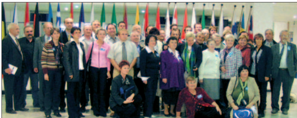
Na pozvání Zuzany Roithové navštívila početná skupina zástupců Ústeckého kraje v říjnu 2005 sídlo Evropského parlamentu v Bruselu a seznámila se s činností evropských politických institucí

Populační vývoj v Evropě je tak alarmující, že by měl vést k novým formám mezigenerační solidarity. Věřím, že se program úcty k mateřství a výchově dětí stane celoevropskou záležitostí.