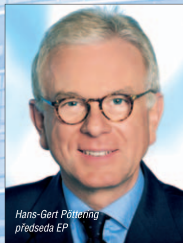
Hans-Gert Pötering předseda EP