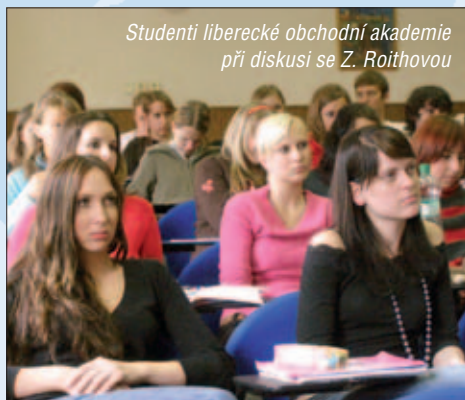
Studenti liberecké obchodní akademie při diskusi se Z. Roithovou