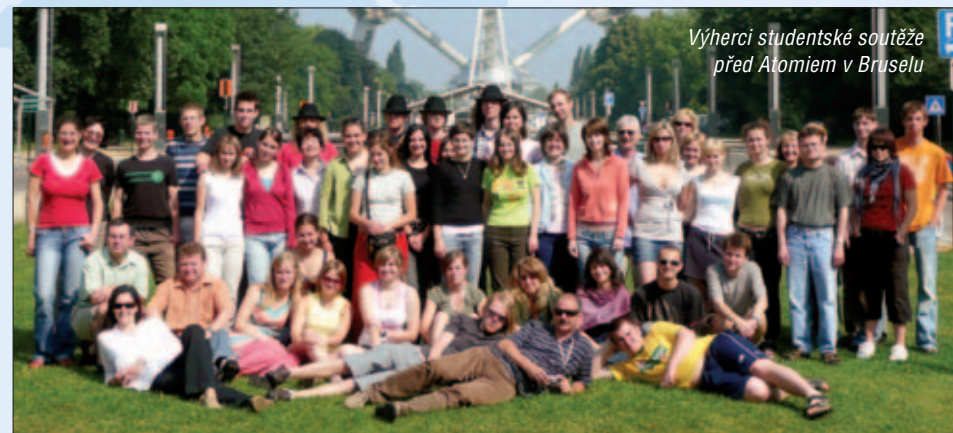
Vítězci studentské soutěže před Atomíem v Bruselu

Na podzim roku 2006 vyhlásila Generation Europe ČR ve spolupráci se Sdružením obrany spotřebitelů a europoslankyní Zuzanou Roithovou soutěž, jejímž cílem bylo zlepšení orientace mladých lidí ve spotřebitelské problematice. Pro nejlepších 8 týmů byl připraven poznávací zájezd do Evropského parlamentu. Na tiskové konferenci v Evropském domě v Praze byly 2. dubna 2007 slavnostně vyhlášeny výsledky soutěže. Naprostým vítězem se staly studentky z Reálného gymnázia Přešov a spolu s dalšími sedmi týmy tak převzaly z rukou Zuzany Roithové certifikát k zájezdu do Evropského parlamentu.