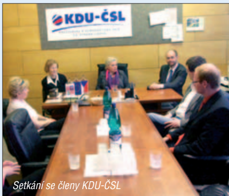
Setkání se členy KDU-ČSL

2. dubna 2007 se přijela Zuzana Roithová podívat do Pardubic. Svůj program zahájila pracovní schůzkou s vicehejtmanem Pardubického kraje Romanem Línkem. Tématem jejich rozhovoru byly možnosti ekonomické a legislativní pomoci Pardubickému kraji v Evropském parlamentu. Zuzana Roithová podpořila také příznivce případného konání některých olympijských disciplín ve východních Čechách a nabídla pomoc skrze své kontakty u nás i v zahraničí.