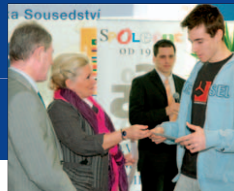
Tisková konference s vyhlášením vítězů studentské soutěže Cesta do EP 2. 4. 07 – Z. Roithová předává certifikát k zájezdu do EP týmu Gymnázia Praha 9 (2. místo)

■ Od května 2001 do listopadu 2003 byla místopředsedkyní KDU-ČSL se zodpovědností za program a zahraniční vztahy. Dále je členkou Celostátní konference KDU-ČSL. Od roku 2000 je členkou Evropského hnutí České republiky,