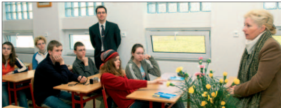
Zuzana Roithová seznamuje s vizí společné Evropy žáky ZŠ v České Lípě

například pro textilky, nedovolené kopírování technologických postupů i značek zejména v automobilovém a počítačovém průmyslu. To vše poškozují evropský průmysl, narušuje rovnou soutěž a prohlubuje nezaměstnanost. Unie by měla prosazovat a hájit vlastní pravidla i mimo Evropu, jinak bude muset záhy rezignovat na své vysoké standardy. Proto je třeba posílit pravomoci evropských institucí v oblasti zahraničního obchodu. Unie se musí stát silným a respektovaným partnerem i vůči Světové obchodní organizaci (WTO).