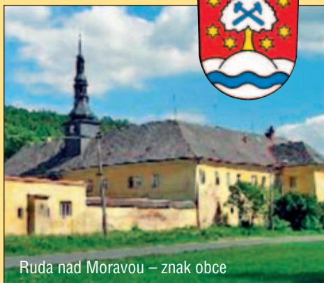
Ruda nad Moravou – znak obce

Rudu nad Moravou najdete v podhůří Jeseníků, v malebném údolí při horním toku řeky Moravy. Založena byla na počátku 14. století na obchodní stezce zvané Jantarová spojující Pobaltí se Středomořím. Už od svého vzniku je obec Ruda nad Moravou přirozeným hospodářským i kulturním centrem pro danou oblast.