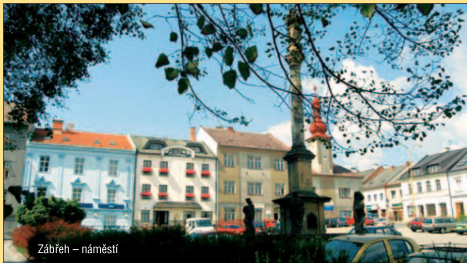
Zábřeh – náměstí

Je potěšující vidět zevnitř, jak se investice připravují, jak postupují i přes různé překážky, které je potřeba překonávat, jak vznikají konečná díla, která budou sloužit občanům dlouhá desetiletí. Je povzbuzující být členem týmu, který chce občanům poskytnout co nejlepší servis a služby. Je dobré a krásné sloužit občanovi. To je úkol politika na jakékoliv úrovni. Jsem rád, že mi to bylo umožněno.