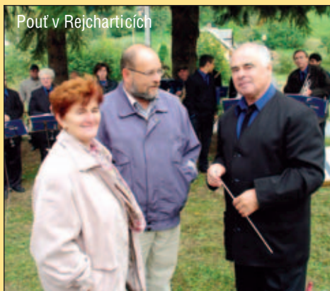
Pouť v Rejcharticích

Stavbu tunelu pod Červenohorským sedlem jsem podporoval již v době, kdy jsem zastával funkci přednosty Okresního úřadu v Šumperku. Bohužel, v té době stavba tunelu narážela na odpor nejen ekologických aktivistů, ale také politiků ČSSD na Jesenicku. Nemusím připomínat, že tunel by byl součástí životně důležité silnice Mohelnice – Mikulovice.