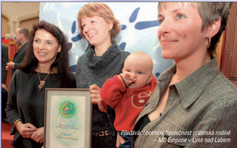
Předávání ocenění Společnost přátelská rodině – MC Empatie v Lysé nad Labem

Evropská unie nemá jednotnou sociální politiku ani jednotnou politiku na podporu rodiny. Společným cílem mezinárodní sítě mateřských center je právě probudit u evropských politiků zájem o rodinu. Tím, že jsme vstoupili do EU, máme možnost se tohoto společného díla účastnit. Nemusíme a ani nechceme čekat, až za nás rozhodnou jiní. Věříme, že se nám krok za krokem podaří splnit naše veliké přání: žít v Evropě přátelské rodině.