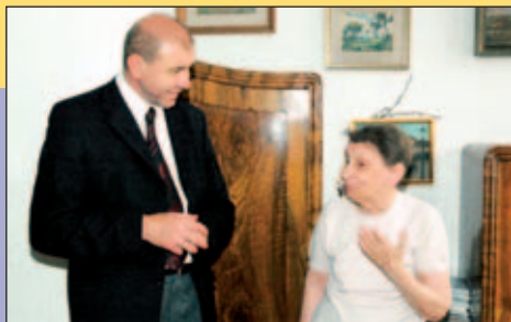
Na návštěvě Domu s pečovatelskou službou

Praha je moderní evropské velkoměsto a vstupem do Evropské unie se tento fakt jenom potvrdil. Počet jejích obyvatel vzrůstá, značné procento přitom tvoří senioři. Jako člen Zastupitelstva hl. m. Prahy jsem přesvědčen, že zajištění důstojného života seniorů by měl magistrát věnovat značnou pozornost. I ve funkci náměstka na MPSV se starám o to, aby se rozvíjela a stabilizovala nabídka sociálních služeb nejen pro důchodce, ale také pro rodiny s dětmi, občany s handicapem a další potřebné. Řadu služeb pro tyto skupiny obyvatel zajišťují neziskové organizace, které mohou čerpat finanční prostředky v řádu stamilionů korun z Evropského sociálního fondu. Pěče o kvalitu ži-