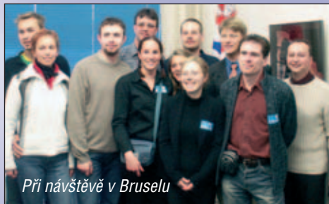
Při návštěvě v Bruselu

Naším cílem je nabídnout mladé generaci dostatek kvalitních informací a pozitivních řešení tak, aby se sama odpovědně rozhodla a naplnění vlastní svobody spojila s křesťanskou demokracií, která je v celoevropském měřítku zastupována právě Evropskou lidovou stranou. Nejen mladí by totiž měli vědět, že křesťanství demokraté nejsou lidmi z jiného světa a že hodnoty, které prosazují, jsou vlastně přirozené a normální v celé Evropě.