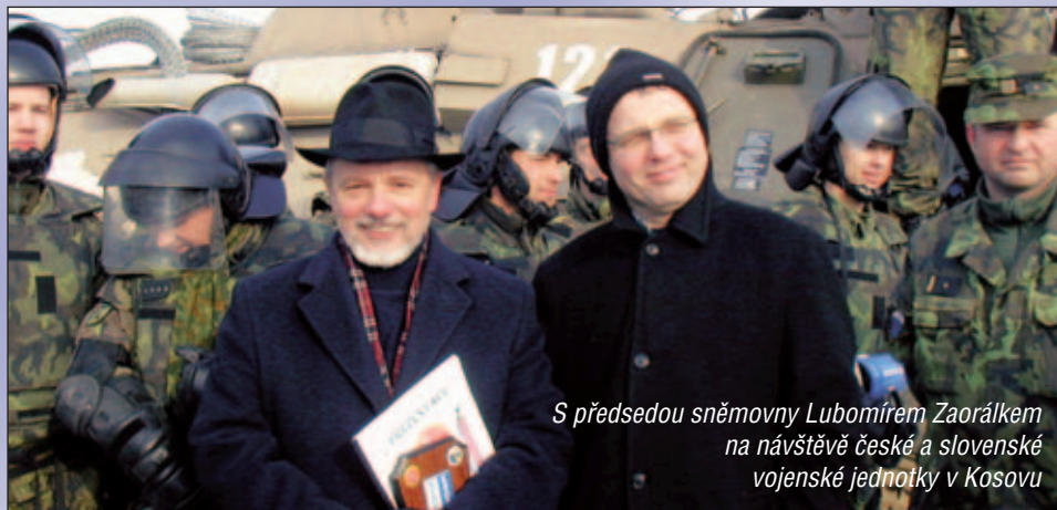
S předsedou sněmovny Lubomířem Zaorálkem na návštěvě české a slovenské vojenské jednotky v Kosovu

lémy může být nástrojem dehumanizace, klonování apod.), etiky médií a tolerance v mezináboženském a mezikulturním dialogu a etické aspekty mezinárodního obchodu.