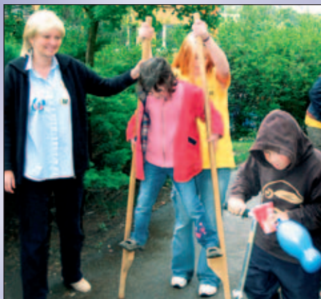
Na zahradní slavnosti v Motýlku

V Motýlku se všichni učí vzájemnému respektu, porozumění a toleranci. V tomto novém společenství se zcela přirozeně odstraňují bariéry mezi světem zdravých a světem handicapovaných, jak je to v Evropě obvyklé.