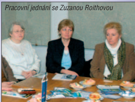
Pracovní jednání se Zuzanou Roithovou

Začleňování znevýhodněných skupin do většinové společnosti má totiž v naší zemi ještě své rezervy. Příkladem je nelehká situace lidí s postižením. Řada z nich musí žít v ústavu, ačkoliv evropský trend je jiný. V ústavních zařízeních je umístěno také zbytečně mnoho dětí s handicapem, jejichž osud je zvláště smutný.