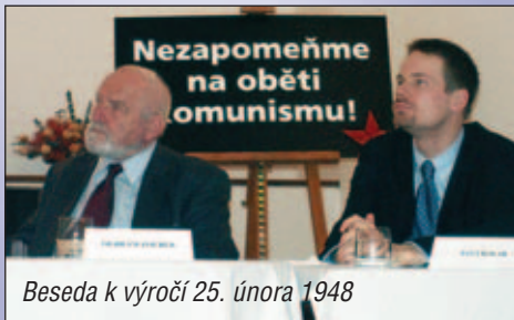
Beseda k výročí 25. února 1948