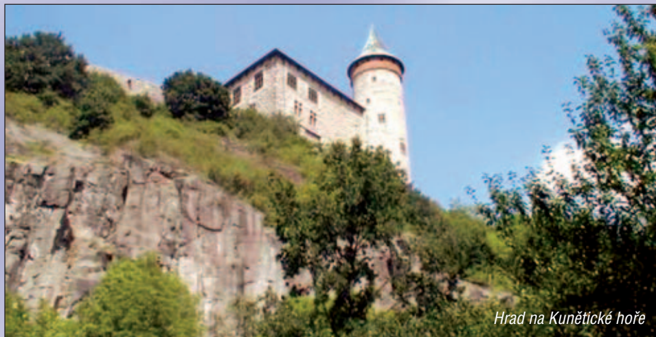
Hrad na Kunětické hoře

Strategickými prioritami klubu ELS-ED v nadcházejících letech je vytvoření oblasti míru a stability na evropském kontinentu, kde by byly respektovány zásady demokracie a právního státu, a posílení našich strategických partnerství.