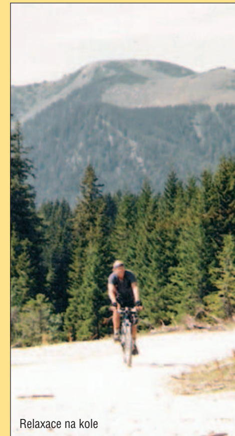
Relaxace na kole

Pro zajištění životaschopného a udržitelného zemědělství je třeba vyřešit tři problémy: V první řadě ekonomický problém, který spočívá v posílení konkurenceschopnosti zemědělského sektoru. V druhé řadě sociální problém, tj. zlepšení životních podmínek a ekonomických příležitostí ve vesnických oblastech. V třetí řadě potřebujeme vyřešit ekologický problém podporou správných ekologických praktik a poskytováním služeb souvisejících s udržováním biologické rozmanitosti a krajiny.