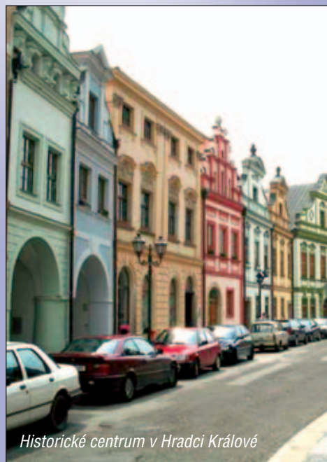
Historické centrum v Hradci Králové

lém regulovaného nájemného netýká. Zbývají byty nájemní. U majitelů domů – obcí lze těžko předpokládat, že by se v případě deregulace chovali sociálně necitlivě. Problém by tedy mohl vzniknout u bytů v domech soukromých majitelů, kterých je ovšem menšina.