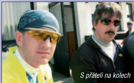
S přáteli na kolech

Hlavním cílem Společné zahraniční a bezpečnostní politiky je zachování míru a bezpečnosti a ochrana společných hodnot, rozvoj demokracie, respektování lidských práv a právního státu.