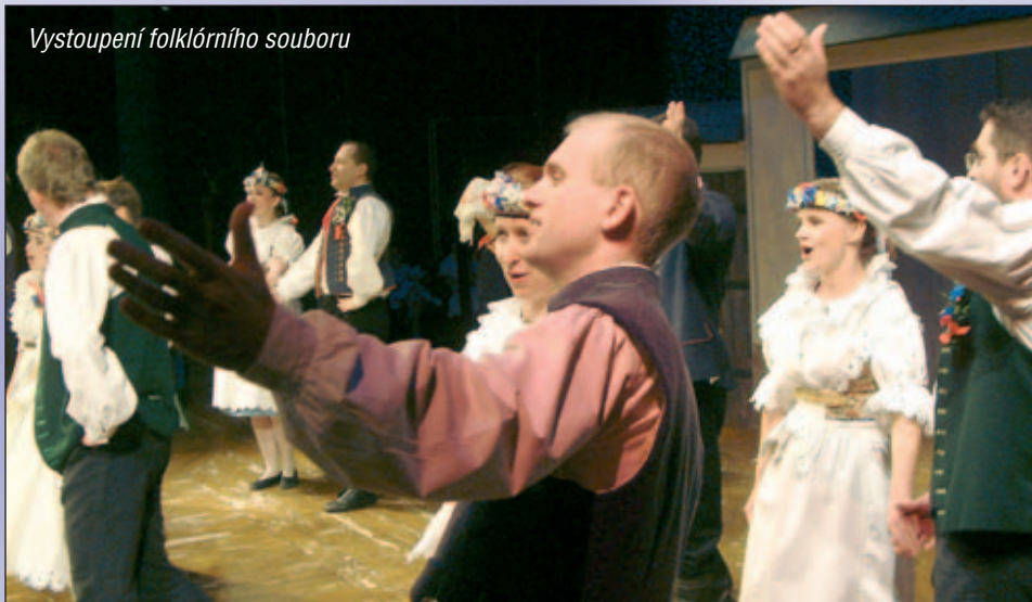
Vystoupení folklórního souboru

rou můžeme ovlivňovat i my. Nevím jak pro vás, ale pro mě to znamená, že se mohu v klidu věnovat činnostem, kterým se generace našich rodičů zdaleka věnovat nemohla.