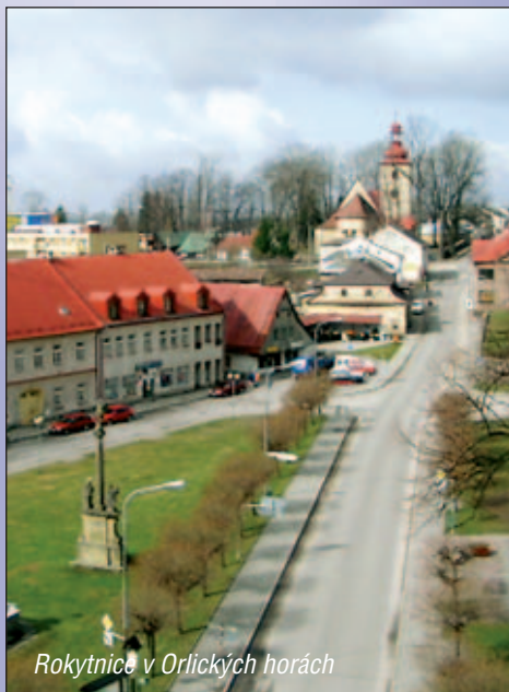
Rokytnice v Orlických horách

mu ho předat? EU jako taková by měla výrazně podporovat rodiny s dětmi a naopak nepodporovat soužití, které nemůže přinést potomky.