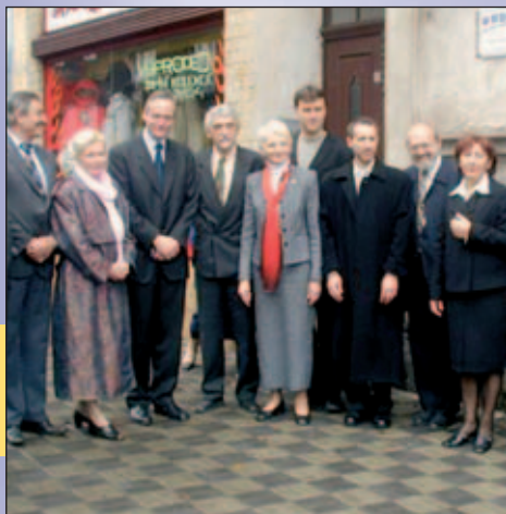
Z. Roithová a C. Svoboda na návštěvě v kraji

Nedomnívám se, že naše neúčast je diskriminující a nejsem zastáncem povinných kvót pro ženy. V každém případě však podporuji angažovanost žen v politice.